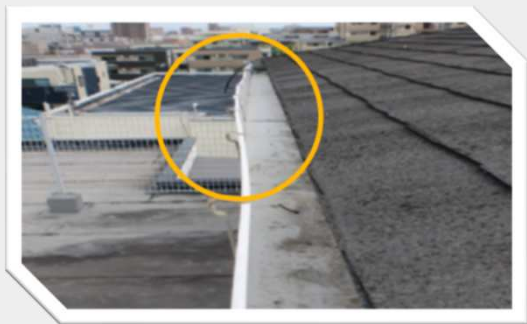
雨樋が歪んでいる